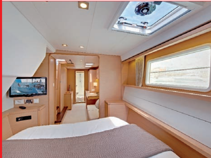
Vue du lit de la cabine propriétaire : géant !