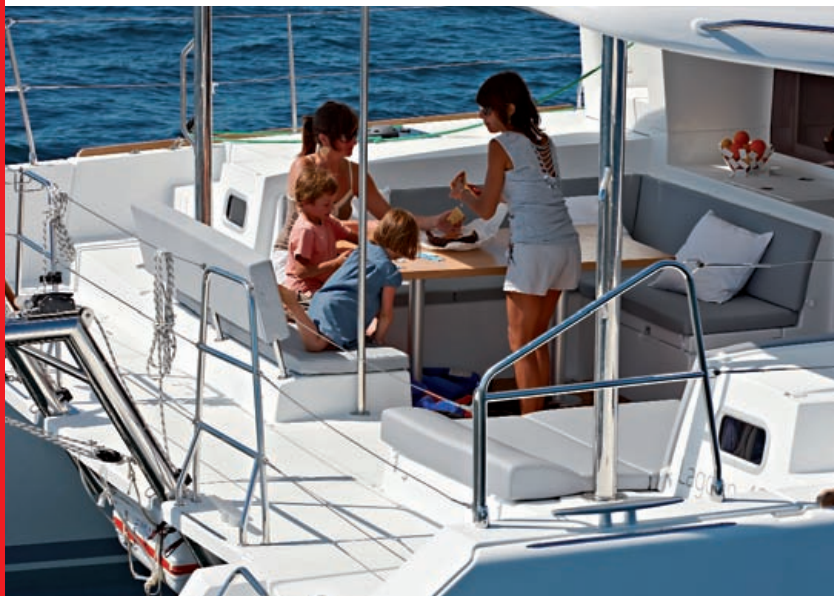
Le cockpit est particulièrement agréable : espace, volumes et différentes zones de vie permettent à tout un chacun de trouver sa place.

vitesse de pointe sont satisfaisants avec les Yanmar 2X54cv et les hélices tripales repliables (Flexofold 17/14). Nous sommes 6 à bord, regroupés autour de l'espace de manœuvre, chacun