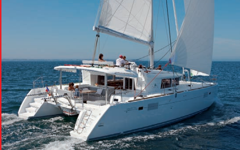
Un comportement agréable et tonique par vent léger, le 450 étonne...

L'accès aux coupures de contact (général et moteurs) est aisé et protégé (dans un logement doté d'un abattant en pieds de lit de la cabine arrière), le pilotage du tableau électrique est intuitif et simple, la réalisation sérieuse, mais un capot de protection des cartes électroniques est à conseiller. Notre bateau d'essai était équipé d'une double commande électrique moteurs fly/table à cartes, potentiellement intéressante pour certaines conditions de navigations hivernales, mais son prix est dissuasif (11 000 euros). 73nd à 2500t/mn, 8.8nd à 3200, le régime de croisière comme la