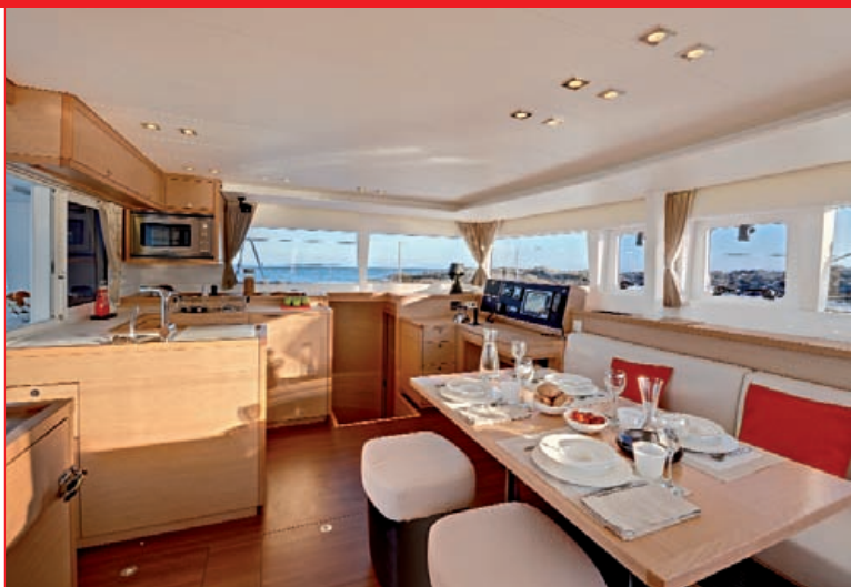
L'atmosphère interne revisitée par Lagoon-Nauta permet au 450 d'exprimer ses ambitions et dévoile un souci réel de qualité...

« Le 450 nous gratifie d'un comportement agréable et tonique dans ce petit médium, il trotte allègrement... »