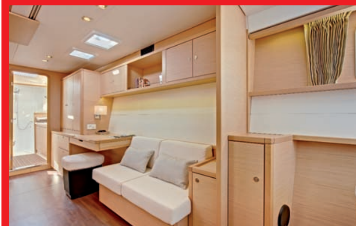
Dans la coursive de la coque propriétaire : et vous n'êtes à bord "que" d'un 44 pieds...