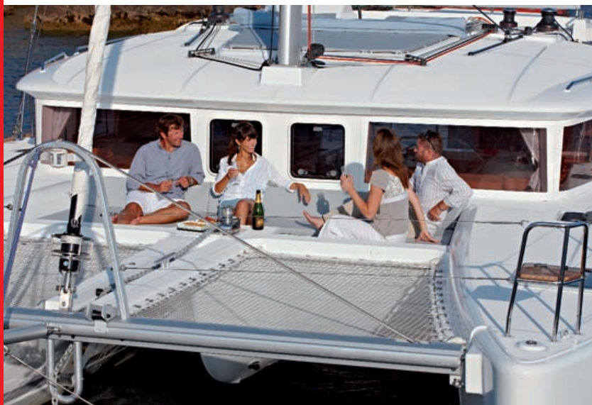
Le cockpit avant : un endroit particulièrement agréable à vivre au mouillage comme en nav.