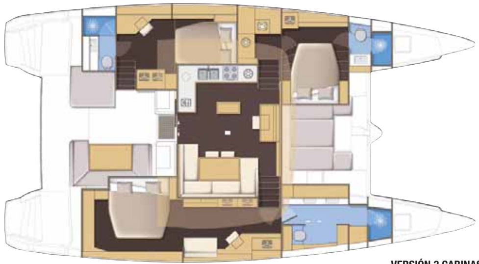
VERSIÓN 3 CABINAS